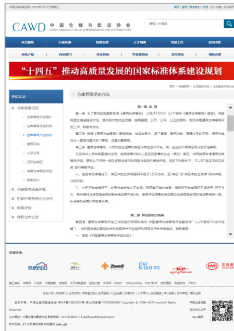
中国通用仓库等级评定办法 中仓协字[2012]9号