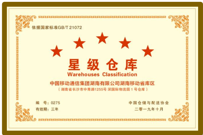
▲ 铜牌 (600mm×400mm)