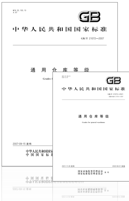
国家标准《通用仓库等级》 GB/T 21072-2007(2021)