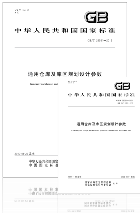
国家标准《通用仓库及库区规划设计参数》 GB/T 28581-2012(2021)